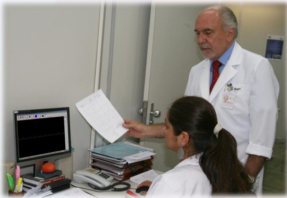
Avaliação dos traçados do exame

É a prestação do serviço de Laudos de Eletrocardiograma de Repouso Adulto e Pediátrico e Sessões de Segunda Opinião Especializada em Eletrocardiografia à distancia. Este serviço pode ser obtido por meio da interlocução com o Centro InCor de Telemedicina e Telessaúde, setor especializado em telediagnóstico e tele-educação.